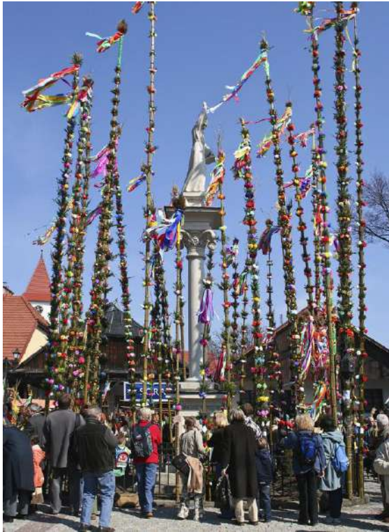
Pologne : les palmes de Pâques

En Hollande , les Chrétiens fêtent les Rameaux avec des branches de houx .