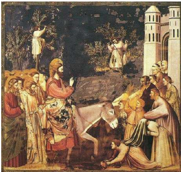
Entrée de Jésus dans Jérusalem Fresque de Giotto di Bondone (1266-1337), Église de l'Arena, Padoue, Italie.

Selon les quatre évangiles canoniques, six jours avant la fête de la Pâque juive, Jésus vient à Jérusalem. La foule va à sa rencontre et l'acclame lors de son entrée dans la ville, il est alors reconnu comme le fils de David, le Messie attendu par le peuple d'Israël.