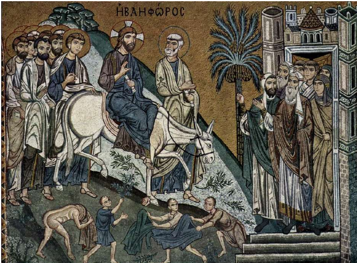
Mosaïque de la chapelle Palatine de Palerme - vers 1150