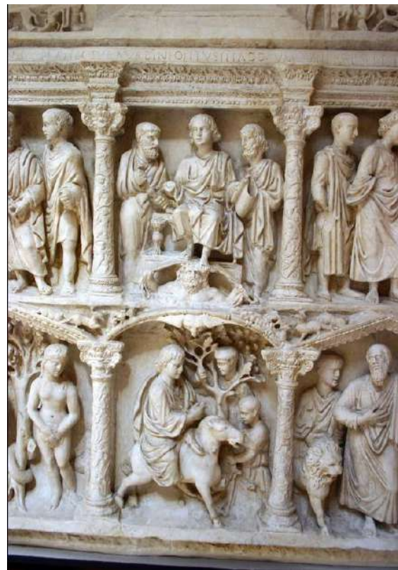
Sarcophage de Junius Bassus, 359

Le dimanche des Rameaux avait encore divers autres noms. On l'appelait dimanche des palmes, dimanche des baies, ou dimanche baïphore, ou porte-rameaux, jour d'Osanna, Pâque fleurie, à cause des fleurs dont on faisait des bouquets, ou que l'on portait sur de hautes tiges à la procession, dimanche de l'indulgence, parce qu'on y faisait la réconciliation solennelle des pénitents publics, Pâque des compétents ou postulants, c'est-à-dire, des catéchumènes qu'on rassemblait ce jour-là pour les admettre au baptême qui devait se donner le samedi-saint ; lave-tête, capiti-lavium , parce qu'en ce jour on faisait la cérémonie de laver la tête à ceux qui devaient être baptisés.