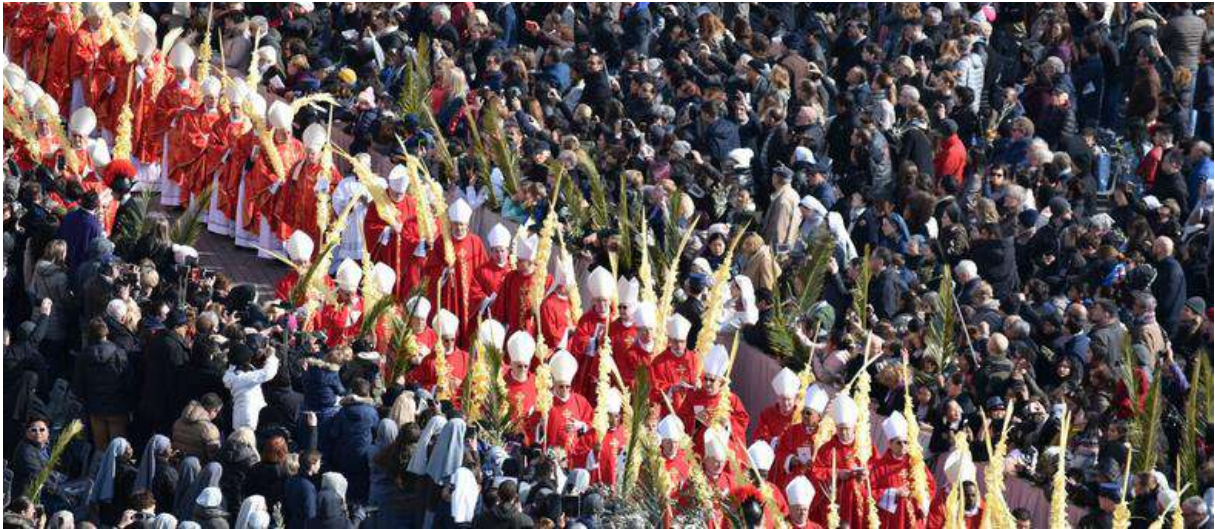
Rome, place Saint-Pierre, Dimanche des Rameaux 2018

Au fil du temps, les parmureli sont devenus plus élaborés mais ils sont encore tissés à la main à Sanremo et Bordighera.