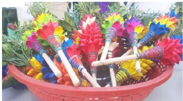
Rameaux décorés avec friandises : accrocher des friandises sur certains rameaux pour faire patienter les enfants. Ils doivent attendre la messe pour y toucher.

Plus surprenant, en Algérie et dans le Sud de la France , une tradition veut (en perte de vitesse) qu'on accroche des friandises sur certains rameaux pour faire patienter les enfants .