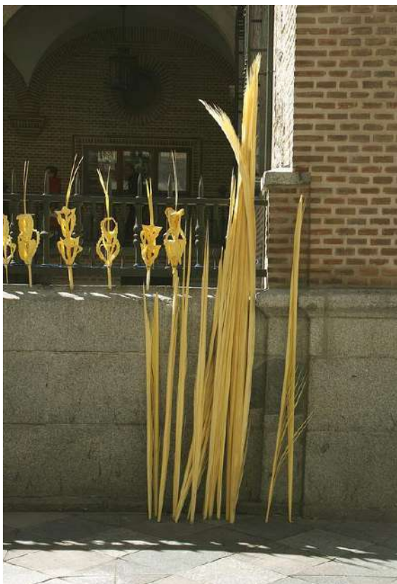
En Espagne, des feuilles de palmiers blanchies et tressées appelées "palmas blancas » sont employées lors de la célébration religieuse.