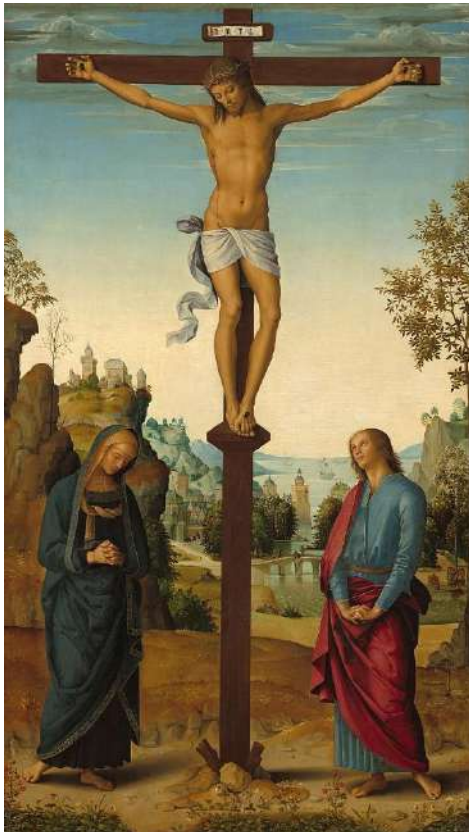
Crucifixion de Jésus Le Pérugin - Domaine public

Ce jour est férié dans un grand nombre de pays dont une partie de la population est chrétienne, par exemple en Allemagne, en Angola, au Canada, en Espagne, en Finlande, en Italie, en Nouvelle-Zélande, aux Pays-Bas, au Portugal, au Royaume-Uni, en Suède ou encore dans certains cantons suisses.