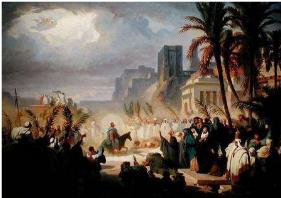
"Dimanche des Rameaux"

La Semaine sainte est composée de cérémonies liturgiques qui n'ont lieu qu'une fois par an. Elle s'ouvre ainsi par le dimanche des Rameaux , considéré comme l'une des douze grandes fêtes de l'année liturgique. C'est un dimanche festif, car il célèbre l'entrée du Christ à Jérusalem, où il est accueilli triomphalement par le peuple tenant des palmes.