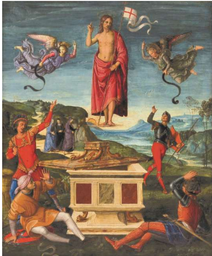
Résurrection du Christ D'après Raphaël (vers 1501) – Domaine public

En France, le Vendredi saint est également férié en Alsace (Bas-Rhin et Haut-Rhin) et en Moselle. Dans ces trois départements, la journée n'est chômée que dans les communes où se trouve un temple protestant ou une église mixte. Ce jour-là en Alsace, les fidèles affluent dans les églises protestantes et certains qui ne vont jamais au culte tiennent à être présents ; on parle d'ailleurs des "chrétiens du Vendredi saint".