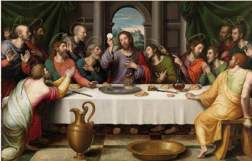
Le dernier souper ou Cène Juan de Juanes ( ?-1579) – Domaine public

Dans l'Église catholique a lieu ce jour-là, la bénédiction des saintes huiles et la confection du saint chrême dans la cathédrale par l'évêque ; c'est la messe chrismale.