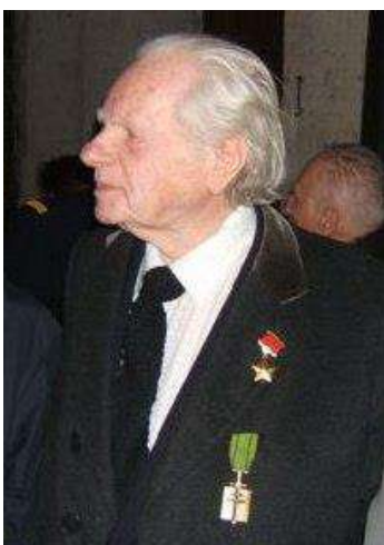
Roland Paulze d'Ivoy de La Poype

Jean-François de La Poype est également honoré par son nom gravé sous l'Arc de Triomphe à Paris.