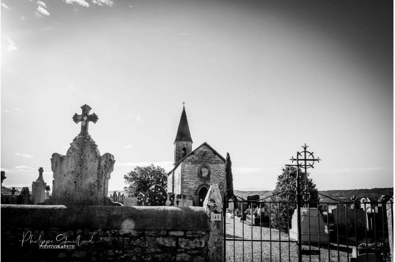
Chapelle de Cozance