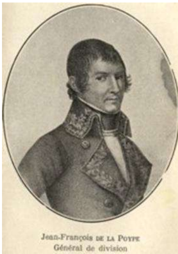
Jean-François de La Poype

Elle a possédé le château de Serrières pendant plus de cinq siècles.